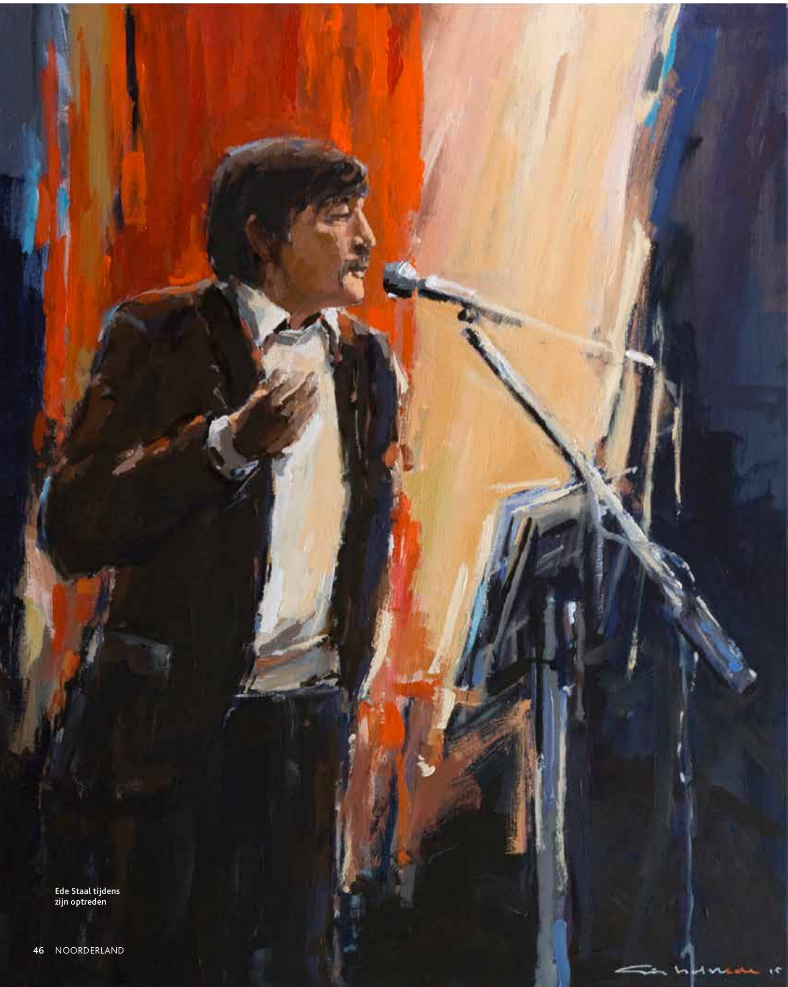
Ede Staal tijdens zijn optreden